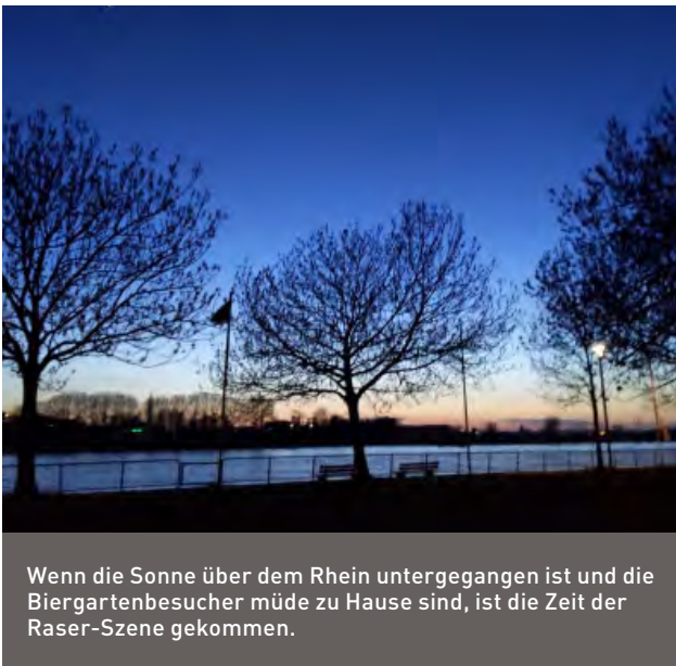
Wenn die Sonne über dem Rhein untergegangen ist und die Biergartenbesucher müde zu Hause sind, ist die Zeit der Raser-Szene gekommen.

Mehrmals im Jahr kommt es sogar zu Unfällen. Dann verlieren die Fahrzeugposser die Kontrolle über ihr Fahrzeug und prallen gegen Bäume oder parkende Fahrzeuge von Anwohnern. So haben schon manche Anwohner ihre ordnungsgemäß geparkten Fahrzeuge wegen eines so verursachten Totalschadens verschrotten müssen.